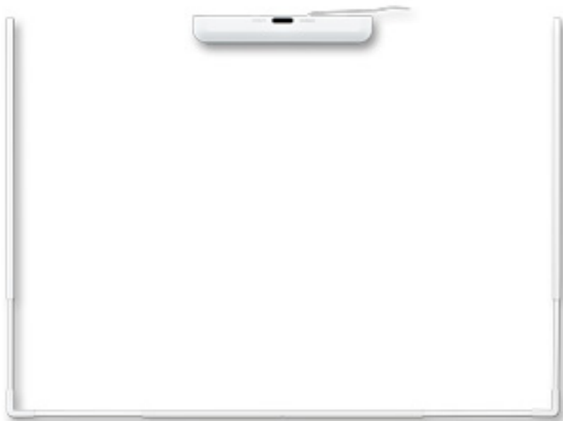
StarBoard Link EZ