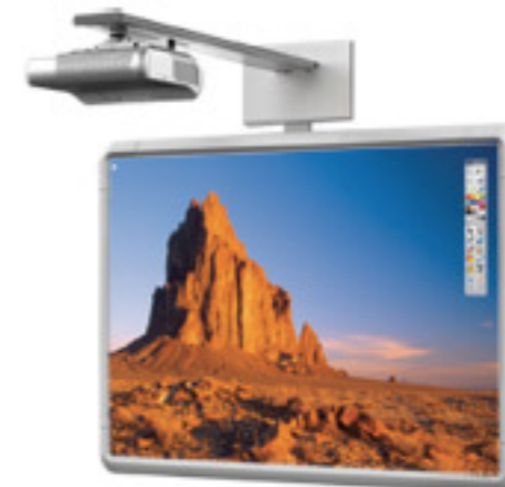
ActivBoard Mount System