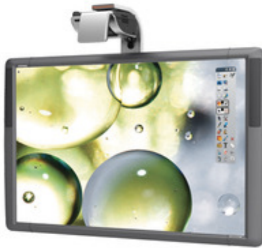
ActivBoard 500 Pro*