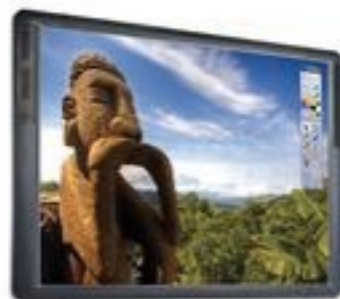
ActivBoard 300 Pro*