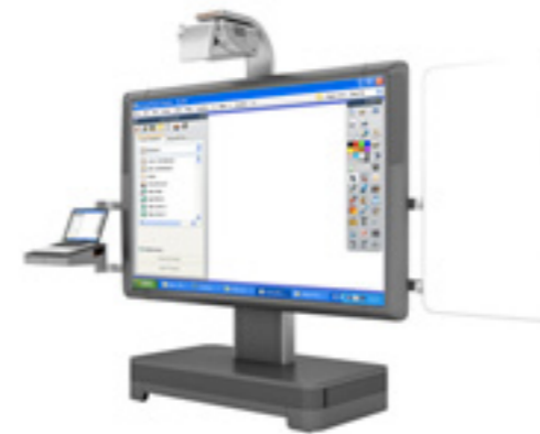
ActivBoard Mobile System